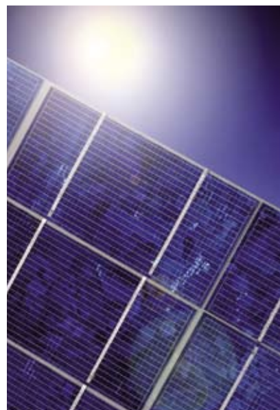
Planibel Clearvision, perfect voor zonnetoepassingen