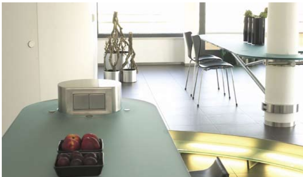
Planibel Linea Azzurra in gesatineerde Matelux versie