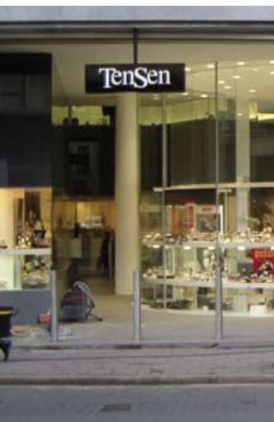
Planibel Clearvision in Stratobel gelaagd glas in juweliersetalage (met dank aan Euroglas De Landtsheer)